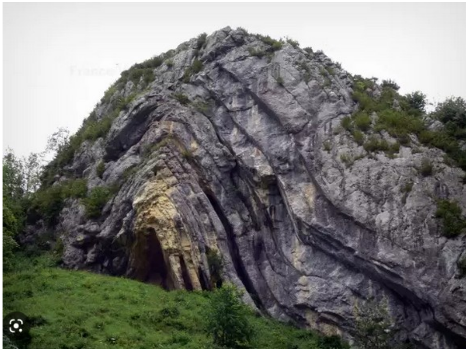
photo 3 : le « chapeau de gendarme » observé sur la commune de Spetmoncel dans le Haut Jura