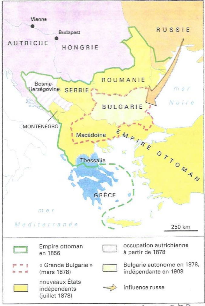
4 Les Balkans après 1878. (Traité de San Stefano mars 1878 ps Congrès de Berlin 1878)