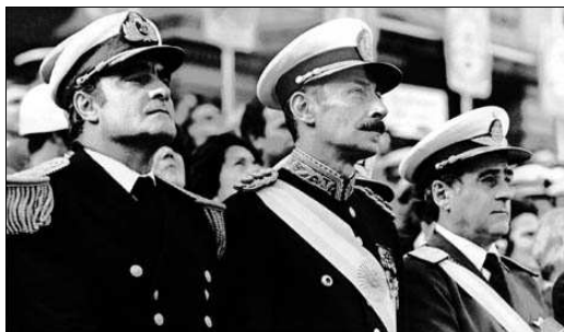
Primera Junta militar, presidida por Videla (1976-1980)

Integrada por un miembro de las 3 Fuerzas Armadas, la Junta tenía un presidente: Rafael Videla (76-80), Roberto Viola (80-81), Leopoldo Galtieri (81-82), Reynaldo Bignone (82-83). La 1 a Junta estaba formada de Videla, Massera y Agosti. La dictadura se autodenominó Proceso de Reorganización Nacional .