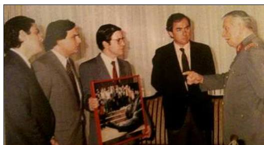
Pinochet y sus “Chicago Boys”

Más que frenar el avance del comunismo, el objetivo de EE.UU era imponer su modelo económico. Pinochet entregó la economía a los Chicago Boys , economistas chilenos alumnos de Milton Friedman y Arnold Harberger. Convirtieron el país en laboratorio del neoliberalismo: se volvió un modelo de crecimiento (un 8% anual, el “Milagro chileno”) pero el paro y la pobreza se dispararon (39% en 1990) -cf. Naomi Klein, La stratégie du choc .