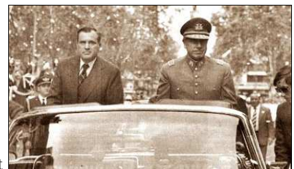
Bordaberry con Pinochet