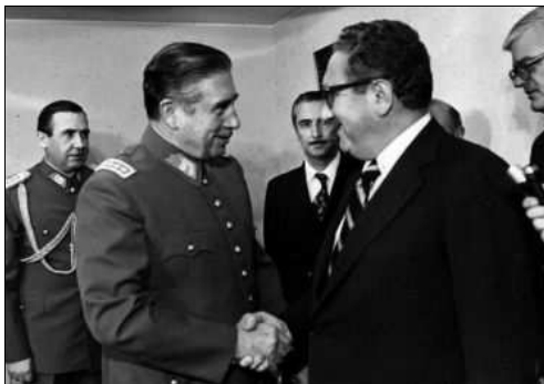
Pinochet con Kissinger después del golpe

Derrocó a Salvador Allende, elegido en 1970 ( Unidad Popular , coalición socialista-comunista). El Ejército bombardeó el Palacio de la Moneda: Allende se negó a rendirse y se suicidó. Fue el 1 er presidente marxista que accedió al poder por las urnas. Su política, la “vía chilena al socialismo”, constituyó un ejemplo peligroso para otros países de AL: nacionalizaciones (cobre, empresas, bancos extranjeros), reforma agraria, congelamiento de los precios, aumento del sueldo de los trabajadores y de los subsidios al sector público.