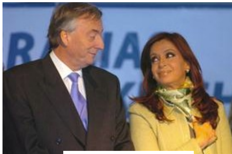
Néstor Kirchner y su mujer Cristina

Un balance económico exitoso : el eslogan más repetido en la era de Néstor Kirchner: " salimos " Kirchner era partidario de un liberalismo con intervención del Estado . Durante su presidencia, las relaciones se tensaron con el FMI: al igual que Brasil, una de las principales medidas de su gestión fue cancelar por anticipado la totalidad de la deuda con este organismo internacional por un monto de 9.810 millones de dólares. El objetivo declarado de ambos gobiernos fue terminar con la sujeción de las respectivas políticas económicas nacionales a las indicaciones del FMI .