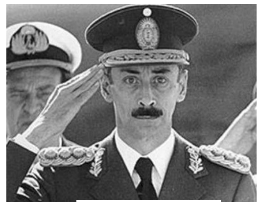
El general Videla