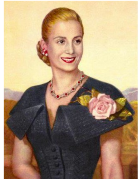
Evita Perón, mito y mujer del controvertido presidente Juan Domingo Perón

El presidente argentino Juan Domingo Perón (1895-1974) se casó con María Eva Duarte (1919-1952) en 1945. Famosa actriz de radionovelas, movilizó a las masas desde su programa de radio y en mítines. Durante la presidencia de Perón nació el mito de Evita , encarnación del asistencialismo populista: los descamisados (término utilizado principalmente por el peronismo a partir de 1945, para referirse al trabajador y simpatizante de ese movimiento político) agradecían su labor al frente de la Fundación de Ayuda Social Eva Perón. Evita fue figura clave del poder personalista de Perón, como organizadora de la rama femenina del Partido Justicialista, al concederse el derecho de voto a las mujeres en 1947. En 1951 el ejército se opuso a ella para la vice-Presidencia. Muy enferma falleció en 1952. El mito se tiñó de tragedia nacional con el secuestro de su cadáver por militares, su traslado a Italia y a España hasta su repatriación a Argentina en 1975 por la Presidenta Isabelita, viuda de Perón. Se continuó con la violación del féretro de Juan Perón en 1987, cuyas manos desaparecieron.