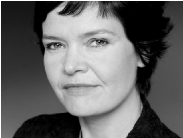
Kate Raworth, autrice de la Théorie du