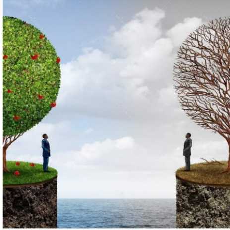
Enjeu de société