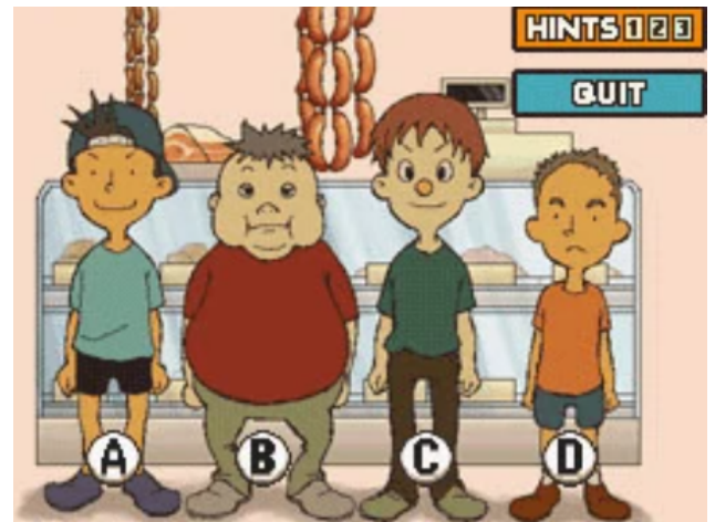
FIGURE 1 – Les quatre suspects de l'affaire

Seul un de ces chenapans dit la vérité , ce qui implique que les autres sont des menteurs. Modélisez la situation avec des variables propositionnelles et des formules adéquates, puis en utilisant les règles de simplification ou les tables de vérité, déterminez qui est le Zouave .