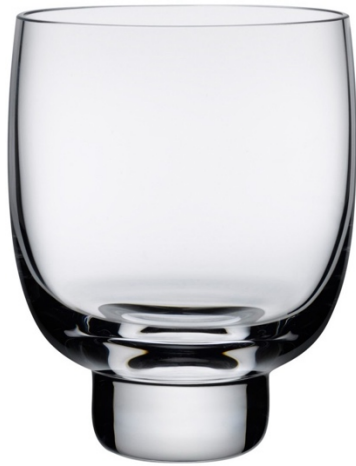
A whisky glass