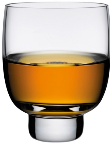
A glass of whisky