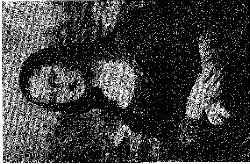
2. Marcel Duchamp, L.H.O.O.Q., 1919. Carte postale retouchée au crayon.