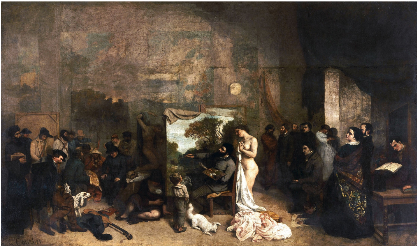
L'Atelier du peintre, Courbet, 1855