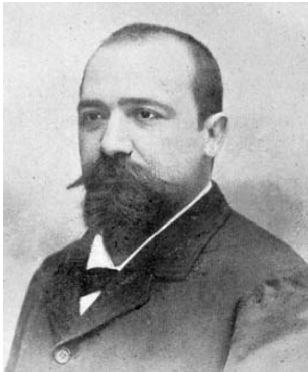
FIGURE 2 – Ernesto Cesàro 1859-1906

4. Réservé aux 5/2. Donner la forme d'un équivalent du terme général de la suite la suite (u_n)_{n \in \mathbf{N}} .